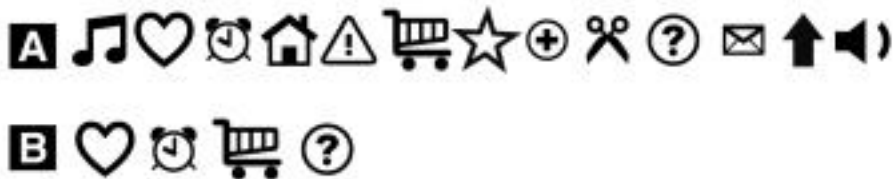
FIGURA TT 26