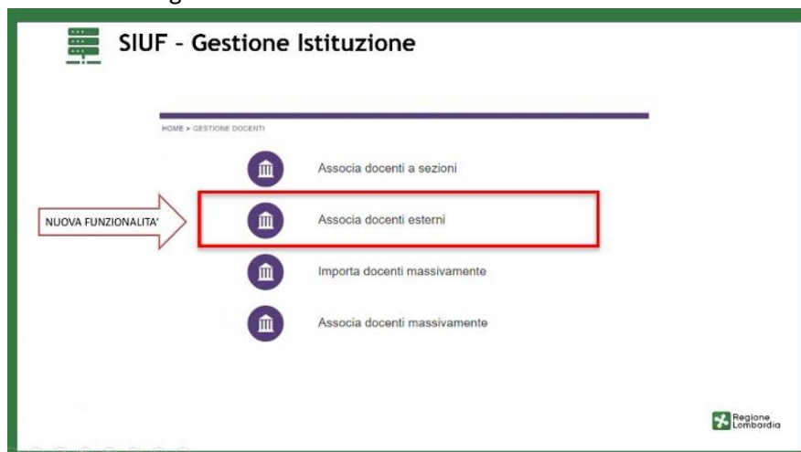
Figura 1 – Gestione Istituzione – Docenti Esterni