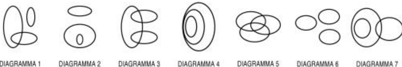
DIAGRAMMA RY 00

2 Rispondere al seguente quesito facendo riferimento al DIAGRAMMA RY 00 Quale delle seguenti serie di termini è legata dalla relazione insiemistica rappresentata graficamente dal Diagramma 7?